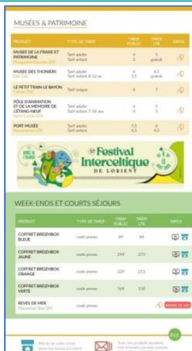
Guide billetterie Encart pub 1/4 de page