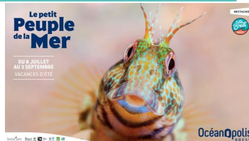
Exemple de bannière newsletter 540*122 px

Notre newsletter est envoyée chaque jeudi à plus de 2580 destinataires .