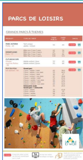
Guide billetterie Encart pub 1/3 de page